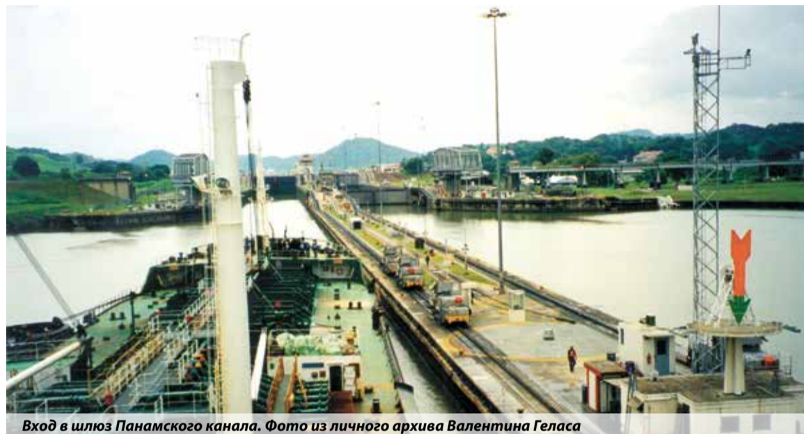
Вход в шлюз Панамского канала. Фото из личного архива Валентина Геласа

Марина Розанова, пресс-служба ГУ МЧС России по Костромской области